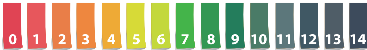
Scala dei valori di pH